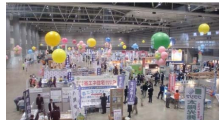
H26.3 (郡山会場：RFCうつくしま住まいとリフォーム博と合同開催)