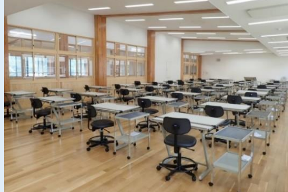
木造棟（建築科）製図実習室

木造の加工技術を肌で感じることができるよう、柱や梁を木材が見える「あらわし」としました。