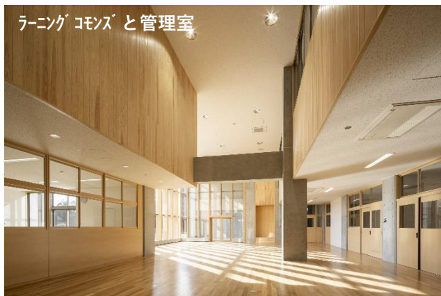
ラーニング コモンズ と 管理室

実習棟には生徒や教職員の自習・談話の場となる『ラーニングcommons』を設けました。建築科など計4科の垣根を越えた交流を図るため、実習棟の中央に配置しています。ガラスのカーテンウォールによる開放感と木質化による暖かみを感じられる空間としました。